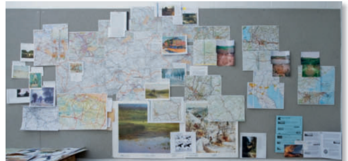
Arbeitswand im Studio der Künstlerin mit Landkarten und Fotos von den Orten, an denen die Erden gesammelt wurden, sowie dazugehörige Referenzgemälde.