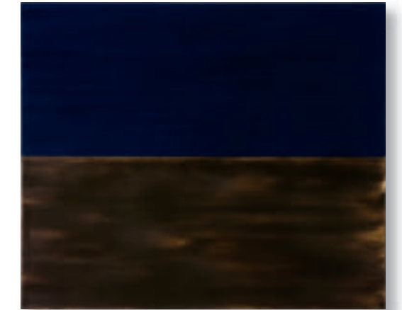
Paris Blue Landscape Painting. 2004 (The Bridge at Courbevoie. Seurat. 1886-87) Öl auf Leinwand/Oil on canvas 46.4x55.3 cm.