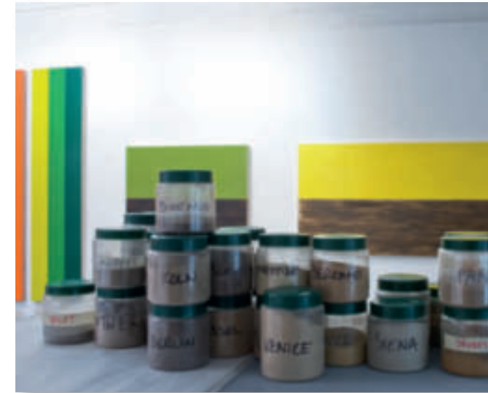
Vorderseite: Venetian Red Landscape Painting. 2011 (Street in Venice. Spitzweg. C1850) Öl auf Leinwand/Oil on canvas 31.5x16 cm