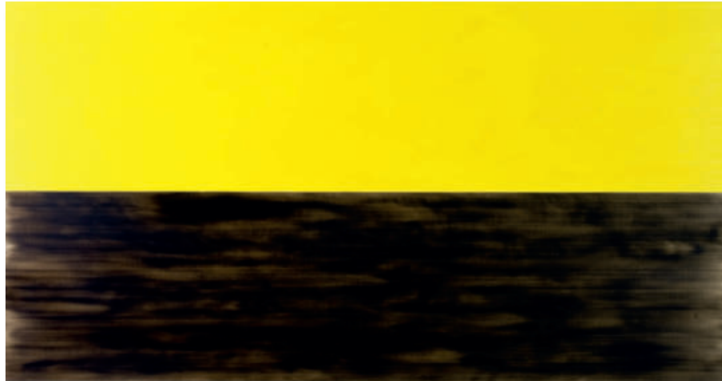
Flanders Yellow Landscape Painting. 2004 (Lamentation. Petrus Christus. C1446-57) Öl auf Leinwand/Oil on canvas 101 x 192 cm

„Landscape Paintings“ – Eine konkrete, nicht gegenständliche Landschaftsmalerei